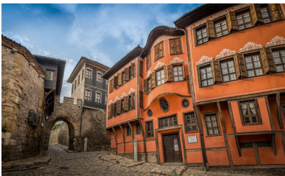
Het historisch centrum van Plovdiv